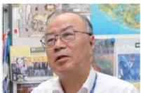
垣内 喜代三 教授